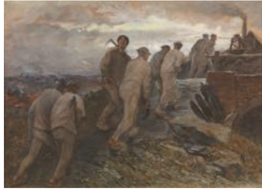
Constantin Meunier Sur le chemin de la mine (1887)

Le texte donne -rend - la parole à ces femmes restées sur le carreau. Au travers de leurs mots, c'est aussi les hommes du fond que l'on fait revivre, les fenêtres et les portes des corons que l'on ouvre pour découvrir la vie sans la mine, la vie d'un quartier avec ses joies et ses peines. Et la solidarité qui unit ce peuple de l'ombre, ces sacrifiés au nom du rendement et du progrès, un progrès qui assassine en toute impunité.